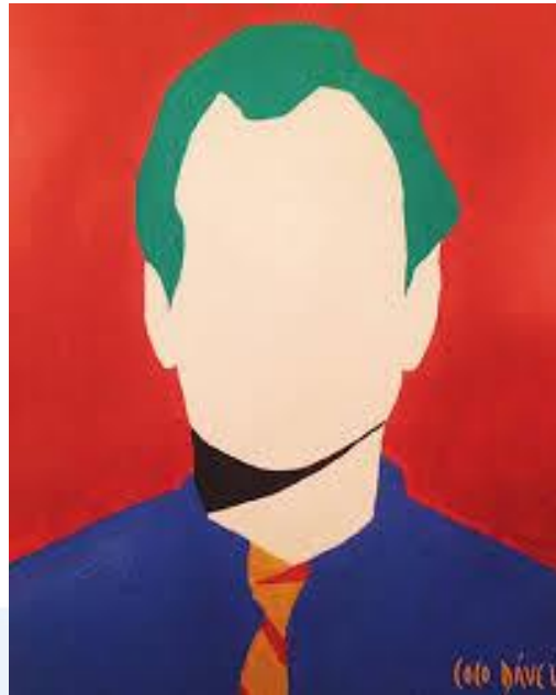
Revisor de avalúos