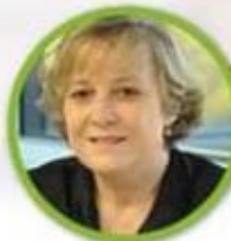
Dana Ababei Rumania 🇷🇴

CEO - International Valuation Standard Council - IVSC