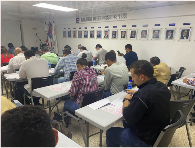
Examen de Procedimientos de Valuación RD

Se entablaron relaciones con ASA American Society of Appraisers para tocar temas sobre valuación de Maquinaria y Equipo, Valuación de Negocios, Empresas en Marcha y Gemas y Joyas entre otras especialidades, que maneja esa organización y se llevó a cabo un curso sobre Maquinaria y Equipo con la presencia de 54 participantes.