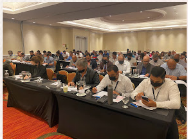
Examen de Principios de Valuación CR

Se ha estado apoyando a la presidencia de UPAV en algunos proyectos adicionales ante organizaciones internacionales como son AI Appraisal Institute donde se han dado dos cursos sobre Principios de Valuación/Internacional y uno con el tema de Procedimientos de Valuación/Internacional, que junto con el Curso de Normas Internacionales de Valuación que imparte UPAV, los que cursen y pasen estas 3 asignaturas podrán obtener el Certificate of Completion, Fundamental International Curriculum , emitido y firmado por el Appraisal Institute y la UPAV Unión Panamericana de Asociaciones de Valuación.